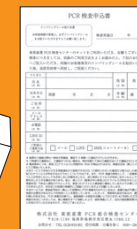
PCR 検査 申込書